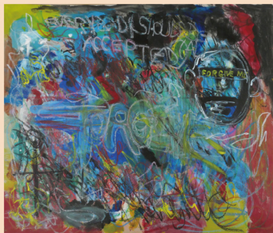
《FORGIVE》2024年、平川市地域活動支援センターおらんど蔵 FORGIVE, 2024, Collection of All Round