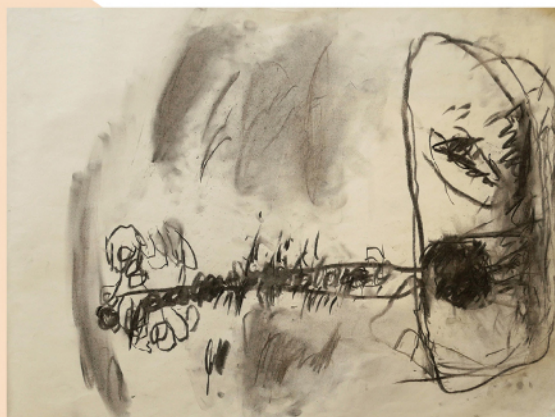
《ギター》2021〜2022年、特定非営利活動法人希望の園蔵 Guitar, 2021-2022, Collection of Kibou-no-Sono(The garden of hope)