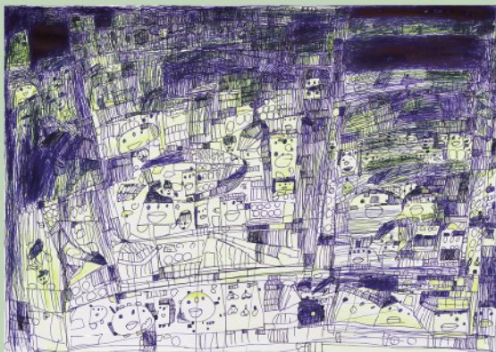
《Untitled》制作年不詳、社会福祉法人みぬま福祉会工房集蔵 Untitled, Date Unknown, Collection of Kobo-Syu

Matsui expresses familiar themes such as flowers and fruits using acrylic and watercolor paints, with free use of color and form. Having created over 600 paintings to date, she continues to actively produce art. Her work has been featured in exhibitions including "The Nippon Foundation DIVERSITY IN THE ARTS The 4th International Art Exhibition" (2022, Bunkamura Gallery / Wall Gallery and elsewhere).