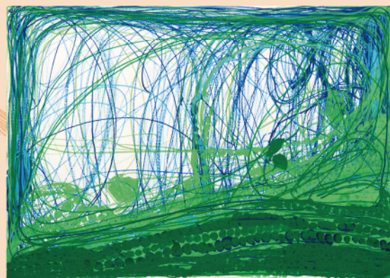
《せっけんのせ》2006年、社会福祉法人みぬま福祉会工房集蔵 Soap, 2006, Collection of Kobo-Syu

Ito depicts subjects of personal interest such as animals and guitars, using charcoal. His works express dynamic energy, combining powerful lines and soft blending techniques applied by finger. Notable exhibitions include "LoVE Gifted: Mie's Untamed Artists" (2023, Mie Center for the Arts).