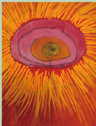
《彼岸花》制作年不詳、作家蔵 Red Spider Lily, Date unknown, Collection of the artist

Tsuchihashi vividly depicts familiar subjects such as flora and fauna using water-based pens and acrylic paints. In 2022, she relocated to Midori Ward, Sagami-hara City, where she continues to create not only paintings but also ceramics and beadwork in an environment surrounded by nature. A notable project she participated in is the "SDGs Color Art Project" (2022).