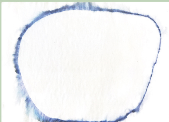
《無心》2020年、株式会社 nullus 蔵 No-Mindedness, 2020, Collection of nullus Inc.