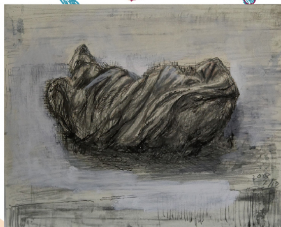
《雑巾の譜》2018年、クシノテラス(柳野展正)蔵 Chronicle of My Cleaning Rags, 2018, Collection of Kushino Terrace (KUSHINO Nobumasa)

Shibata consistently creates works themed around soap bubbles. Recently inspired by the unique sensation and sound of drawing on canvas with ballpoint pens, he continues to produce his works with great enthusiasm. His art has been featured in exhibitions such as "Art Brut from Japan, Another Look"(2018, Collection del' Art Brut, Lausanne, Switzerland).