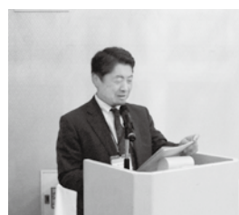
来賓紹介 渋木副理事長