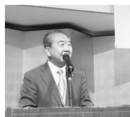
関連企業代表挨拶 設楽社長