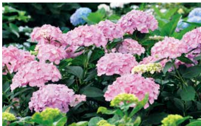
📷 足立神社「あじさい祭り」③

〈川越市増形地内〉40年以上列車が通らない西武鉄道安比奈線。夕陽がレールを照らし、恰も現役路線のようです。