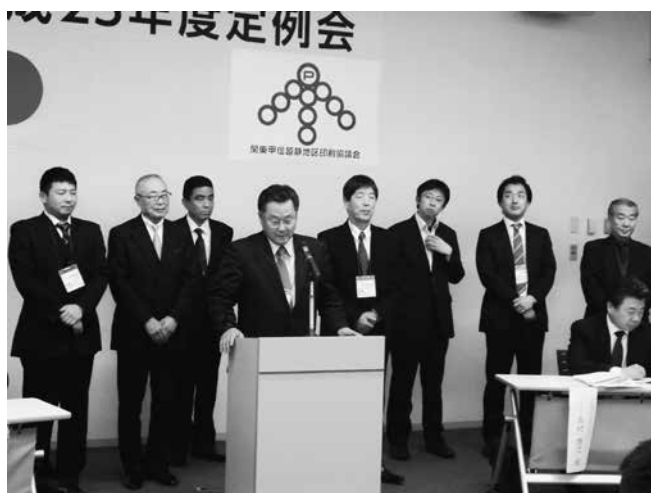
次年度主管は神奈川県工組