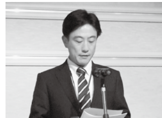
新青年部会長綱領唱和