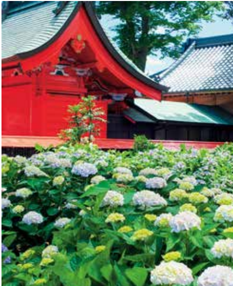
📷 足立神社「あじさい祭り」①