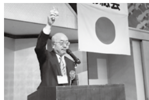
協議会日暮会長の乾杯