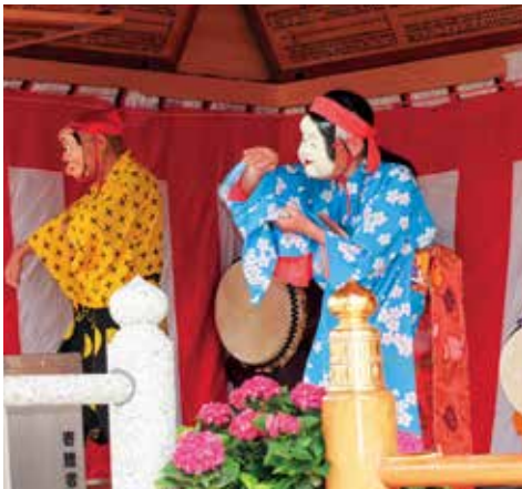
📷 足立神社「あじさい祭り」②

〈さいたま市西区〉秀飯舎のすぐそばの足立神社では毎年6月にあじさい祭りが開かれます。約800株の様々な種類のあじさいが、明るい雰囲気のある境内に彩りを添えています。