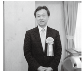
来賓 城戸教育・研修委員長