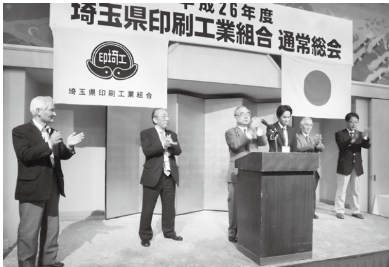
締めは熊谷・鴻巣支部