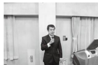
締めの前にひとこと 金縄会員