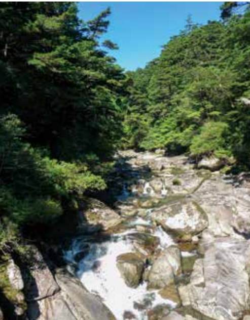
屋久島・ヤクスギランド