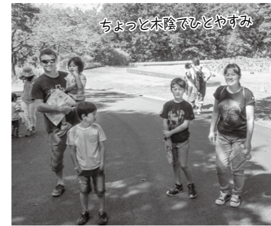
ちょっと木陰でひとやすみ