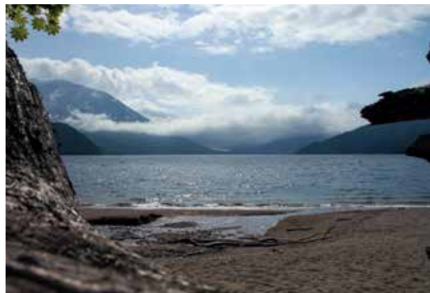
夜明けの千手ヶ浜 片 香織 (株)アサヒコミュニケーションズ 足元から見た景色が大好きです。