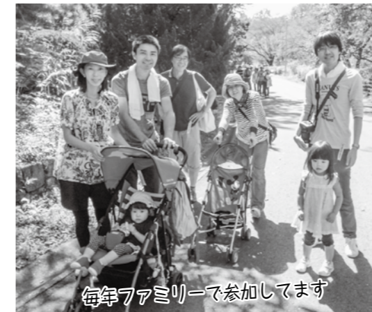
毎年ファミリーで参加してます