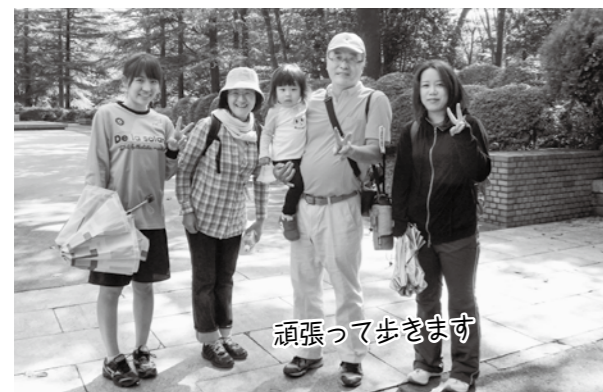
頑張って歩きます