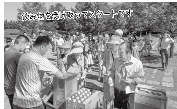
飲み物を受け取ってスタートです

出発はいきなり坂道。5~60m登るだけなのに、もうつらいし、先行きが不安…。でも徐々に楽になり、気持ち良くなるから不思議。身体は確実に運動を欲しています。