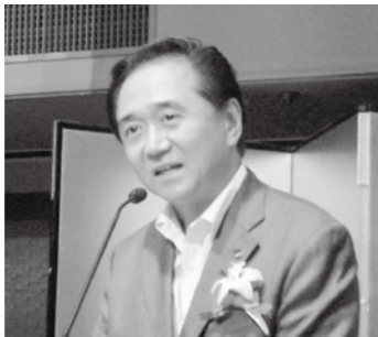
神奈川県知事 黒岩氏