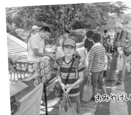
おみやげいただきました!