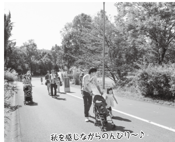
秋を感じながらのんびり~♪