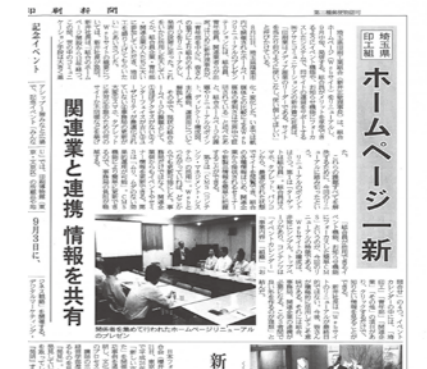
日本印刷新聞(2014年9月1日発行)に掲載していただきました。