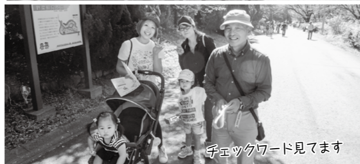
チェックワード見えます