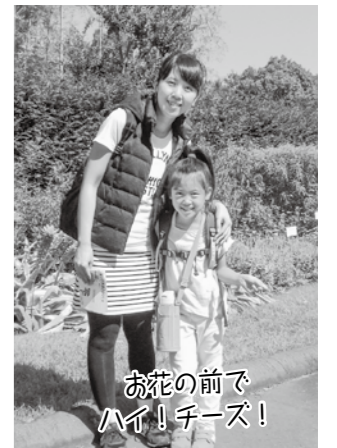
お花の前でハイ!チーズ!