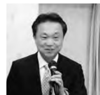
城戸教育委員長挨拶