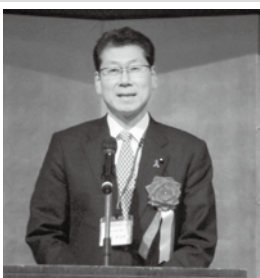
埼玉県議会議員 宮崎栄治郎様