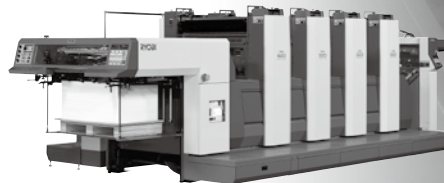
A全判高速オフセット4色印刷機 RYOBI 924

〒114-8518 東京都北区豊島 5-2-8 TEL 03-3927-3300 http://www.ryobi-group.co.jp/