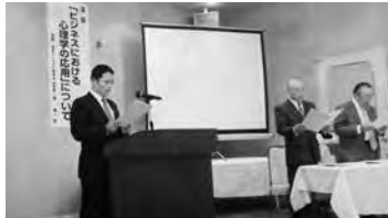
印刷産業人綱領唱和 篠木会員