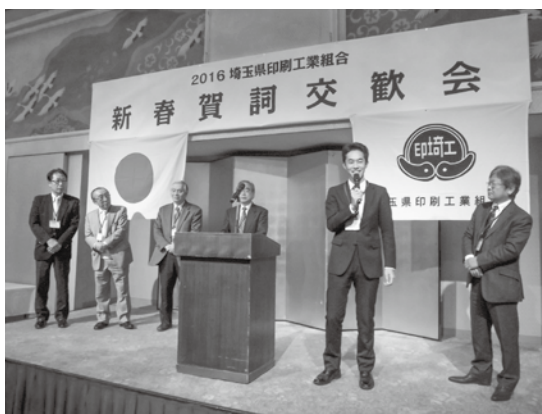
壇上熊谷・鴻巣支部