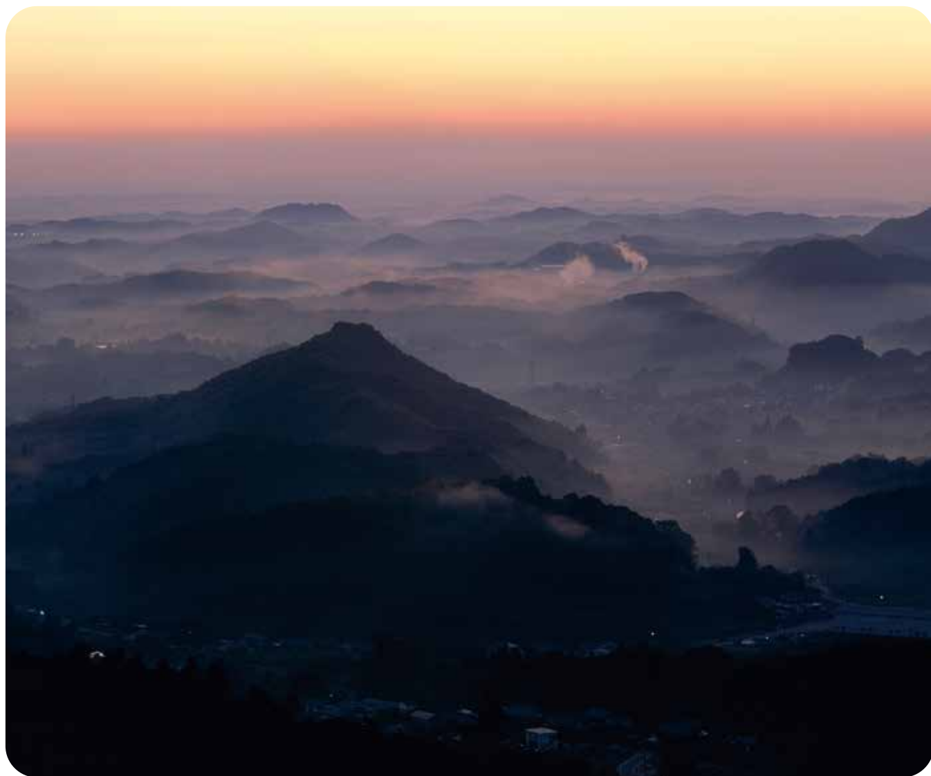
寄居町中間平の夜明け