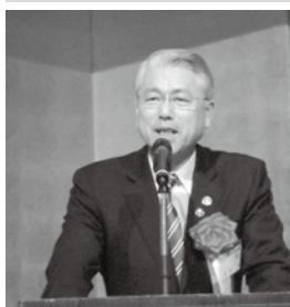
熊谷市長 富岡 清様