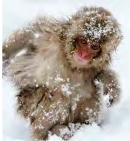
📷 子猿(長野県地獄谷にて) 椎橋俊夫 (株)博友社