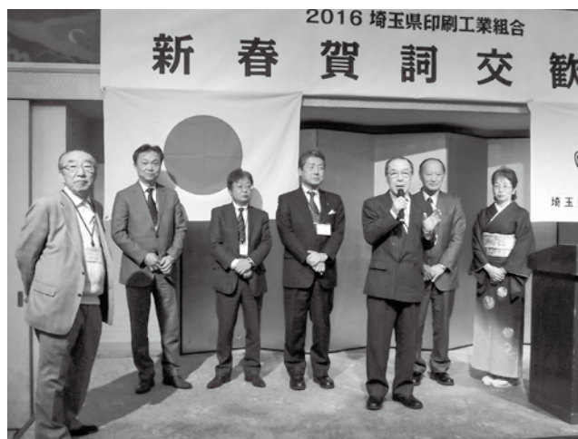
各委員長より一言