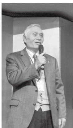
熊谷支部を代表して椎橋監事