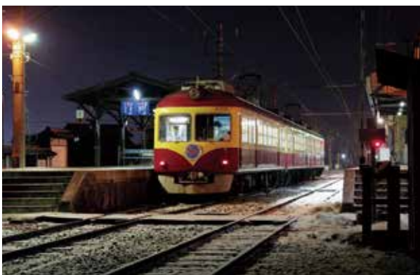
〈長野電鉄 小布施駅〉 うっすら雪の積もった駅に電車が着くと数人の乗客が足早に家路に着きました。