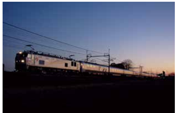
冬の夕暮れの中、北海道を目指し寝台特急カシオペアの一夜の旅が始まりました。