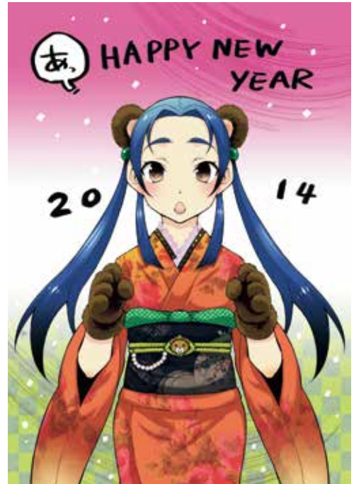
「熊谷ちゃんのお正月」 神山英美古 (有)木暮印刷