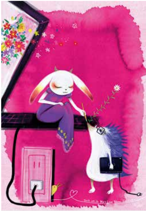
「愛の花」 神山英美古 (有)木暮印刷