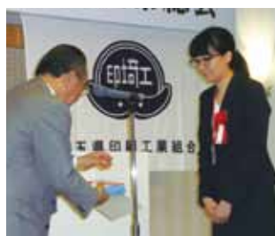
埼玉県教育長賞 新座高等学校