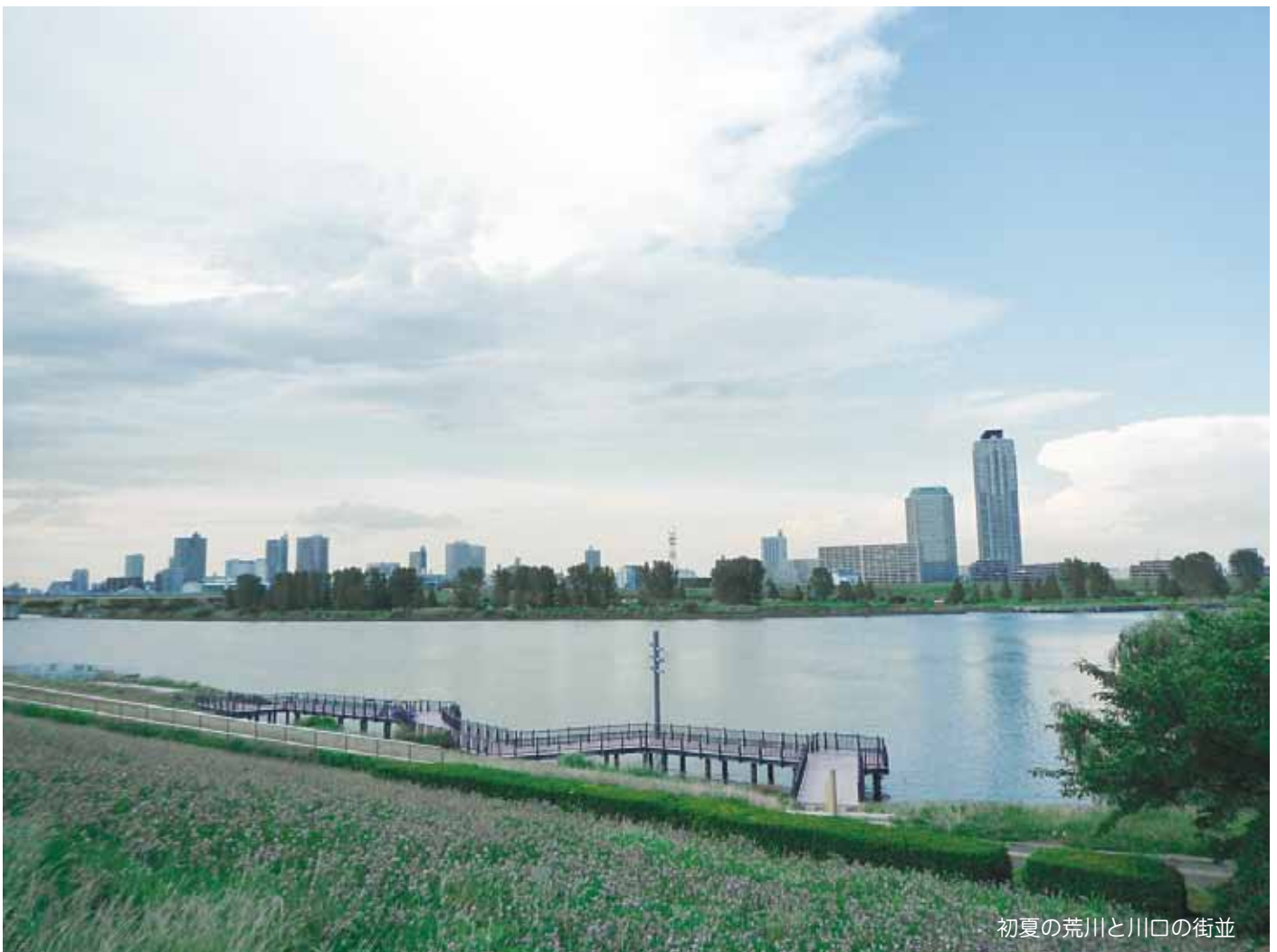
初夏の荒川と川口の街並