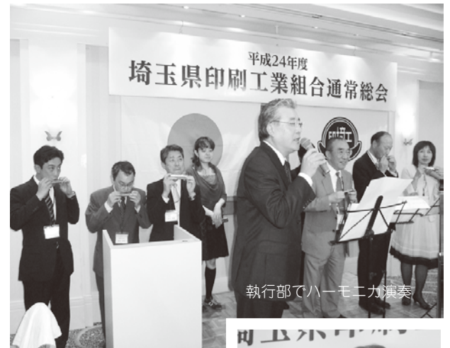
執行部でハートフル演奏