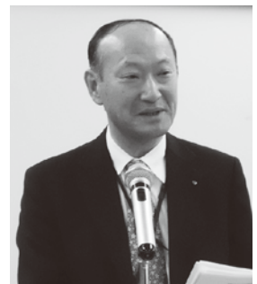
岩瀬委員長 分科会報告