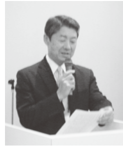
来賓 関連紹介 渋谷副理事長