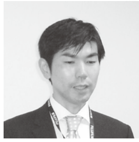
収支決算報告島田会計