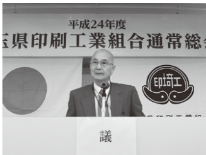
議長 浦和支部 新保組合員