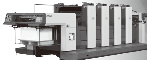
A全判高速オフセット4色印刷機 RYOBI 924

東日本ブロック 東京 〒114-8518 東京都北区豊島 5-2-8 TEL 03-3927-1031 http://www.ryobi-group.co.jp/