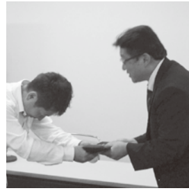
卒業生に記念品贈呈