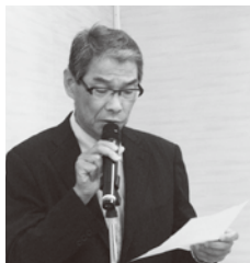
司会 鬼形常任幹事