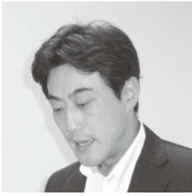
事業報告新副会長