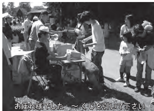
お疲れ様でした ～くじを引いて下さい