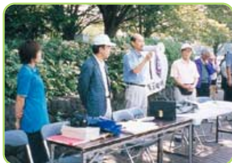
新理事長、元気なあいさつ