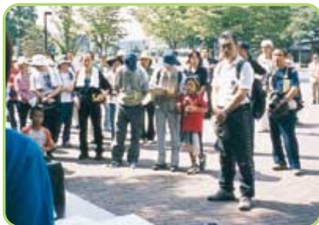
開会式 今回参加者280名