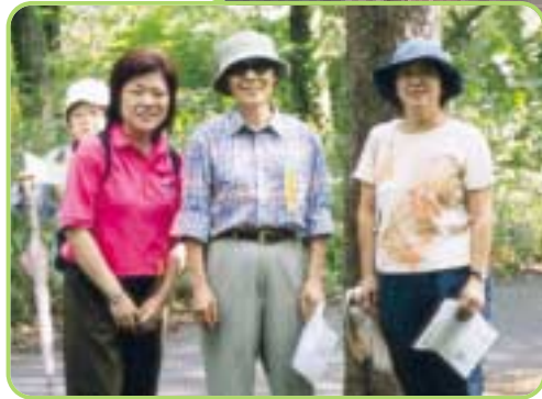
完歩して爽やか気分