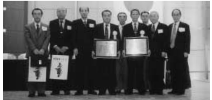
受賞された萩原・市川両氏を囲んで