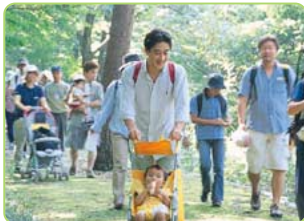
若いお父さん、お母さんのベビーカー連れが目立つ