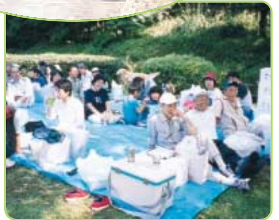
さあ、楽しみのお弁当