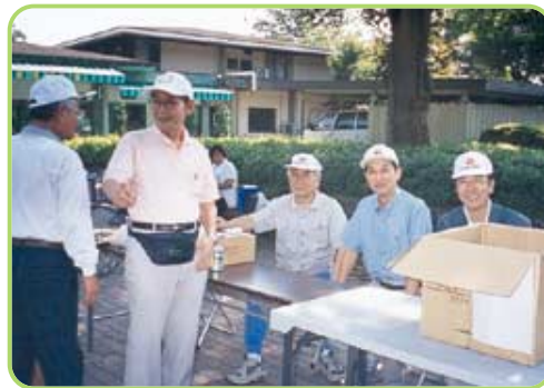
はい、おみやげ交換しますよ